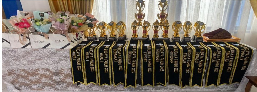
Gambar 6 Piala

Jl. Prof. K. H. Zainal Abidin Fikri No.KM. 3, RW.5, Pahlawan, Kec. Kemuning, Kota Palembang, Sumatera Selatan 30126